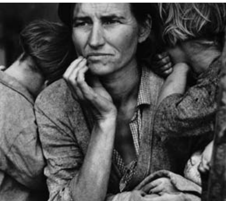
Detalle Migrant Mother , California, 1936. Dorothea Lange. Colección Álvarez Sotos