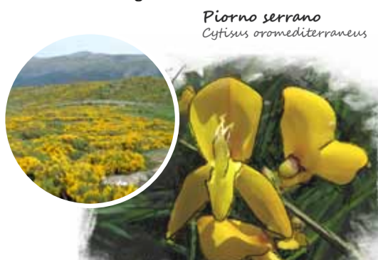
Piorno serrano Cytisus oromediterraneus

El piorno serrano ( Cytisus oromediterraneus ), apenas suele alcanzar el metro de altura, y se encuentra perfectamente adaptado al medio donde se desarrolla. La robustez y elasticidad de sus ramas, su tupido entramado de tallos y su aspecto acojinado, le permiten aguantar los fuertes vientos, la nieve y el frío. Los piornales protegen al suelo de la erosión y permiten que se desarrolle en su interior una intensa actividad biológica.