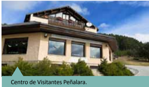
Centro de Visitantes Peñalara.

El Centro de Visitantes Peñalara es la puerta al macizo homónimo, algo más que un centro donde recibir información sobre los valores naturales y culturales de Peñalara y del resto del Parque Nacional, rutas, etc. Es además un lugar desde el que se organizan, controlan y canalizan las visitas para minimizar los impactos que ocasionan los miles de visitantes que recorren estas cumbres, donde los grupos organizados deben recoger una autorización para acceder al Macizo, así como informar sobre sus visitas. Además se ofrecen consejos, recomendaciones e indicaciones sobre la seguridad de esta zona de alta montaña, especialmente en la época invernal.