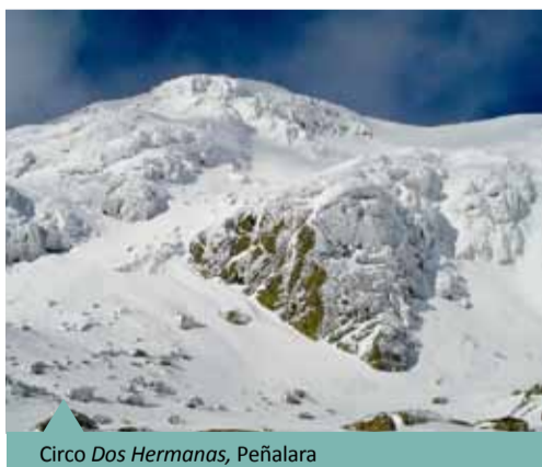
Circo Dos Hermanas, Peñalara

Con 2.428 metros el pico Peñalara es la cima del Parque Nacional y de la Sierra de Guadarrama. Da nombre al macizo montañoso que muestra la cara más alpina de esta sierra, con varios riscos, aristas, paredes verticales, fondos de circo, morrenas, lagunas, etc., que componen un paisaje muy singular modelado por el hielo. La ladera madrileña acoge al antiguo Parque Natural de la Cumbre, Circo y Lagunas de Peñalara, quizá uno de los espacios naturales protegidos más emblemáticos de la Comunidad de Madrid.