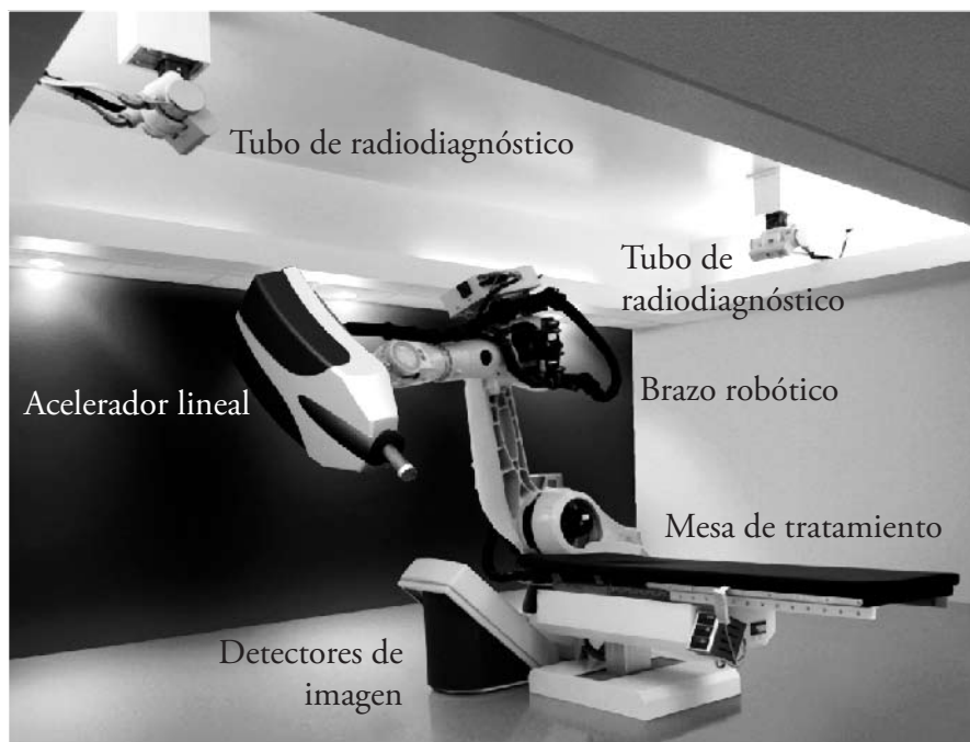
Figura 1. Sistema de Radiocirugía Cyberknife

El brazo robótico es controlado por ordenador y tiene 6 grados de libertad, posicionando al LINAC sobre el paciente en más de 100 posiciones. Los tubos de radiodiagnóstico acoplados a los detectores de imágenes de rayos x determinan la posición del acelerador lineal sin la necesidad de marco estereotáxico. Para la localización de la lesión utiliza como sistema de referencia puntos radiográficos internos como la estructura ósea o marcadores radio-opacos implantados cerca de la lesión.