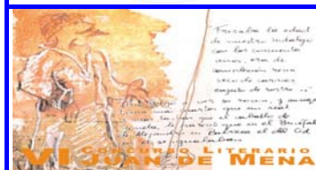
Portada del CD