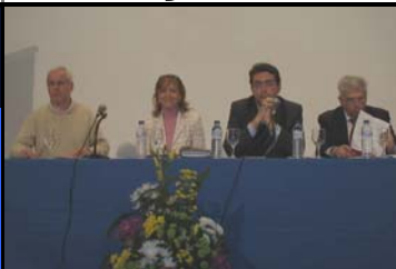
Presentación del Consejo Escolar en Torrelaguna