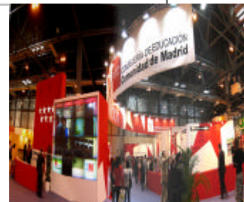
Proyecto Madrid éxito para todos.