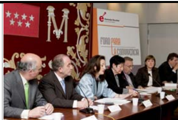
Constitución del Foro para la Convivencia