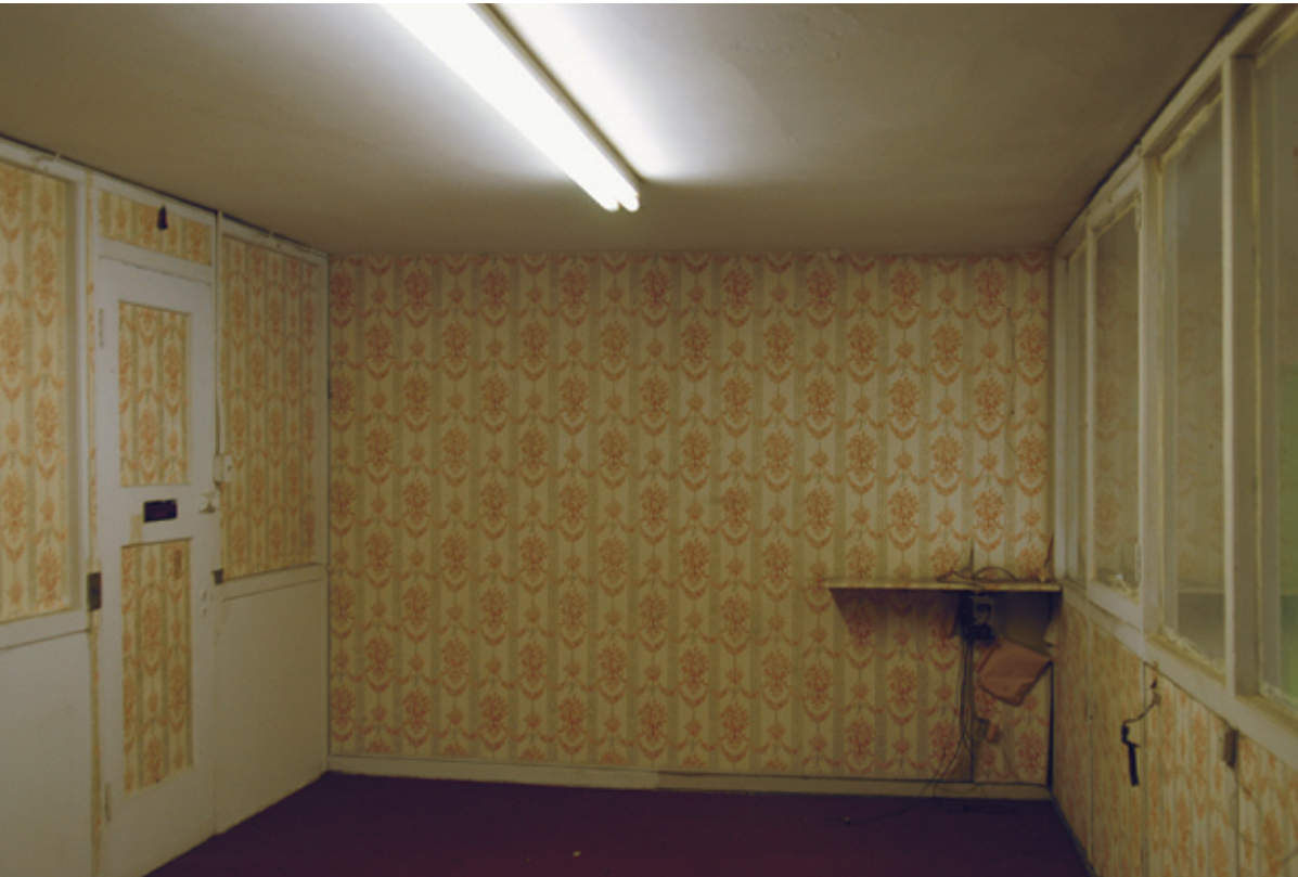
Raqs Media Collective, Activo y Pasivo—Assets and Debts , 2014 [List. 1]