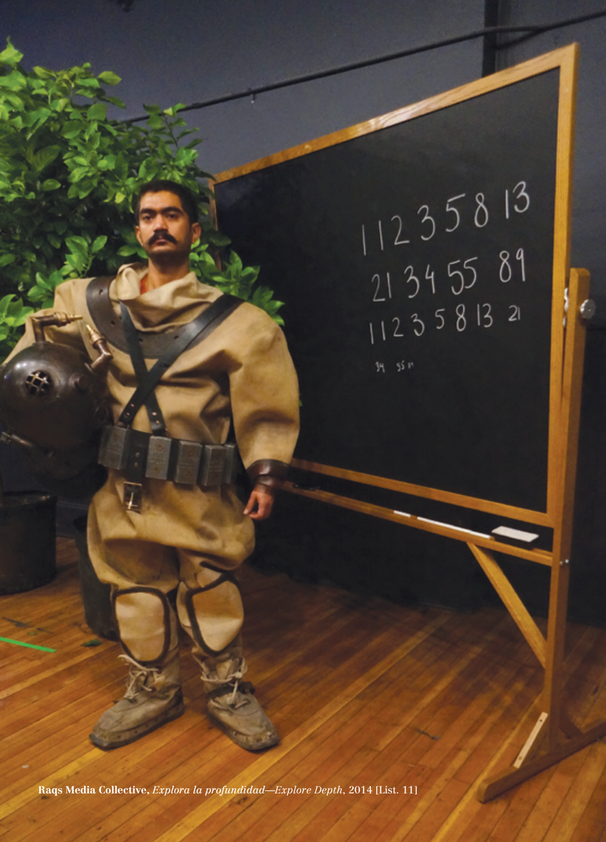
Raqs Media Collective, Explora la profundidad—Explore Depth , 2014 [List. 11]