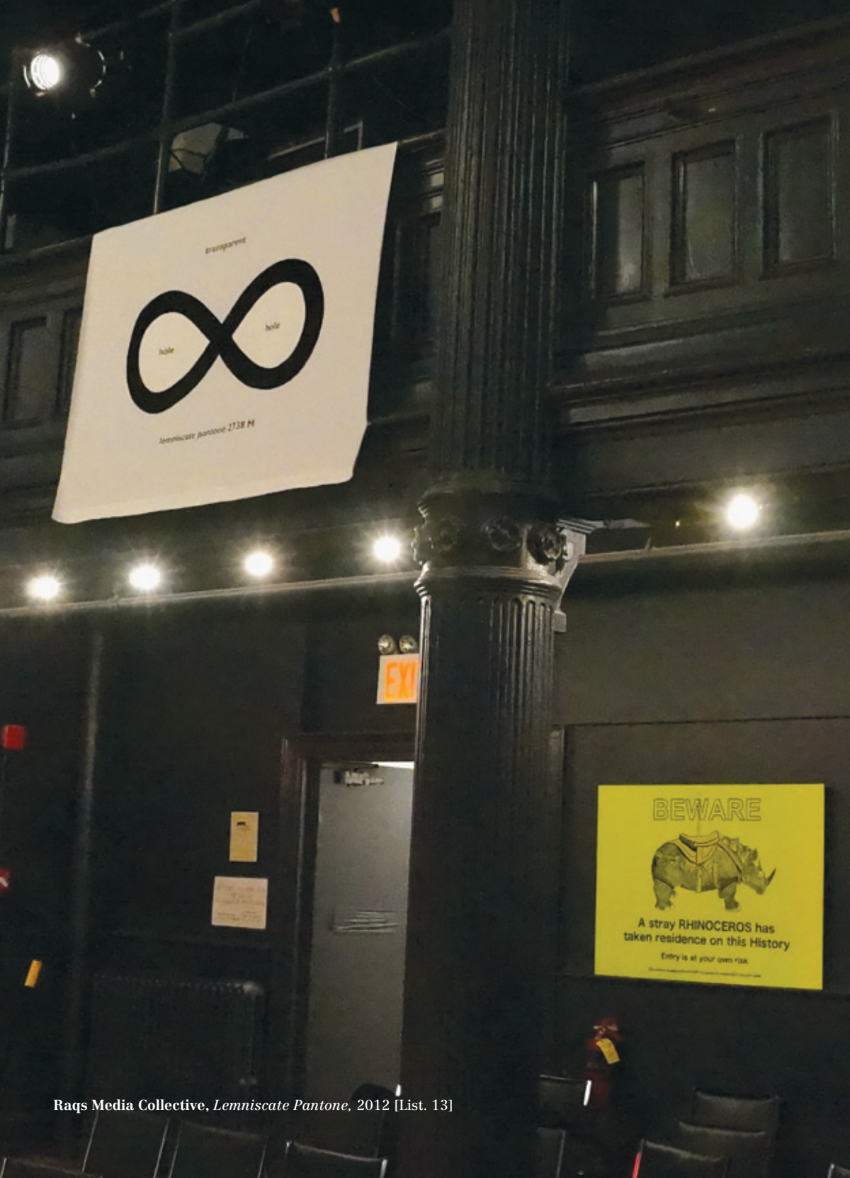
Raqs Media Collective, Lemniscate Pantone , 2012 [List. 13]