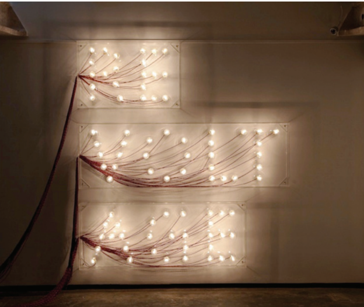
Raqs Media Collective, Revoltage , 2010 [List. 18]

FERRAN BARENBLIT (FB) CUAUHTÉMOC MEDINA (CM)