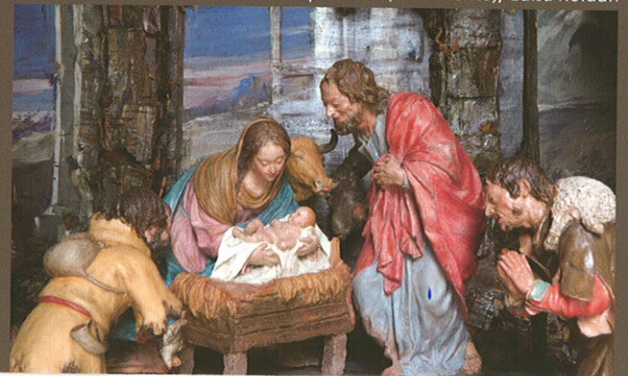
Adoración de los pastores (Nacimiento) , Luisa Roldán

Llegarán obras de otras regiones del Imperio, como la Virgen con el Niño y Ángeles (Descanso en la Huida a Egipto) de Antoon Van Dyck o la Anunciación de Luca Giordano. Se instalarán pintores como Vicente Carducho, Juan Carreño de Miranda, Francisco Rizi, Alonso Cano o Juan Antonio de Frías y Escalante y escultores como Juan Sánchez Barba o La Roldana.