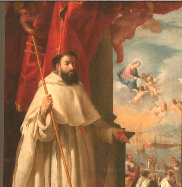
San Pedro Nolasco , Juan de Toledo

El hecho más trascendente para nuestra región es la decisión de Felipe II de convertir en capital a Madrid en 1562, y la construcción del Monasterio del Escorial; con este motivo llegan artistas foráneos y obras como el Juicio Final de seguidor de Jean Cousin o la Lamentación por Cristo muerto , copia de Perino del Vaga.