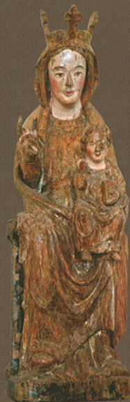
Virgen con el Niño (Virgen del Castillo) , Anónimo español, siglo XIII

Desde el comienzo de la Edad Media toda la región estuvo influida por los modelos toledanos, como podemos ver en las tallas de la parroquial de Montejo de la Sierra. A partir del XIV, en especial a lo largo del siglo XV, crecen enclaves urbanos como Madrid, se erigen grandes edificios y muchos artistas, algunos foráneos, se trasladan a la región para trabajar. Así llegarán obras de origen flamenco como la Virgen con el Niño , del taller de Malinas, y el Tríptico de la Epifanía , del Maestro de la Santa Sangre.