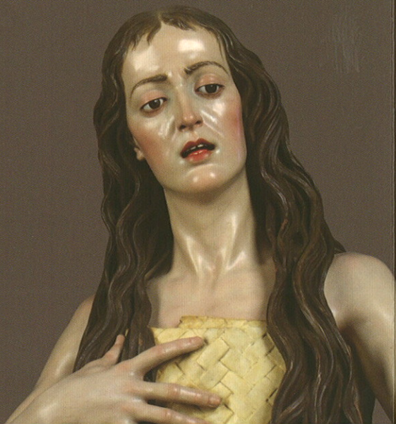
Santa María Magdalena, Luis Salvador Carmona