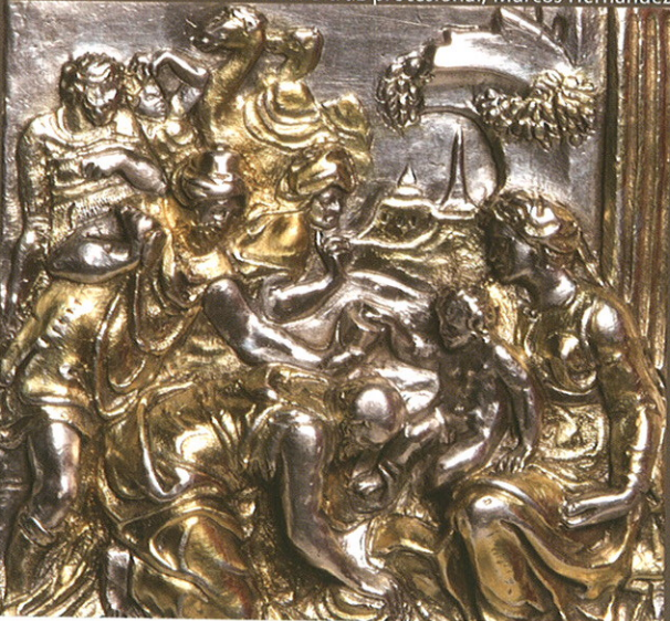
Detalle cruz procesional, Marcos Hernández

En relación con los bienes inmuebles, la exposición da cuenta a través de audiovisuales de algunos de los proyectos de restauración más relevantes ejecutados durante los últimos años.