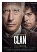
EL CLAN Director: Pablo Trapero El Deseo, Telefónica Studios (en coproducción)