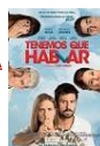
TENEMOS QUE HABLAR Director: David Serrano Atresmedia Cine, Atípica Films