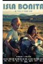
ISLA BONITA Director: Fernando Colomo Coca-Cola Iberian Partners, Camba Films (en coproducción)