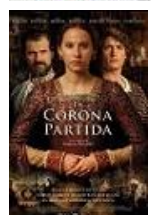
LA CORONA PARTIDA Director: Jordi Frades Televisión Española (en coproducción)