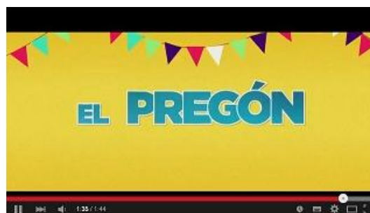
EL PREGÓN , de Dani de la Orden Atresmedia Cine / El Terrat