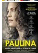
PAULINA Director: Santiago Mitre Telefónica Studios (en coproducción)