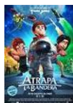
ATRAPA LA BANDERA Director: Enrique Gato Lightbox Entertainment, Telecinco Cinema, Telefónica Studios, Los Rockets AIE (en coproducción)