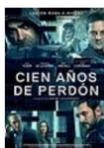
CIENT AÑOS DE PERDÓN Director: Daniel Calparsoro Morena Films, Telecinco Cinema, Telefónica Studios (en coproducción)