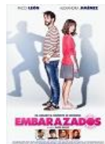
EMBARAZADOS Director: Juana Macías Teoponte PC, Audiovisuales del Monte, S.L. (en coproducción)