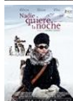
NADIE QUIERE LA NOCHE Director: Isabel Coixet Mediapro, Canal + España (en coproducción)