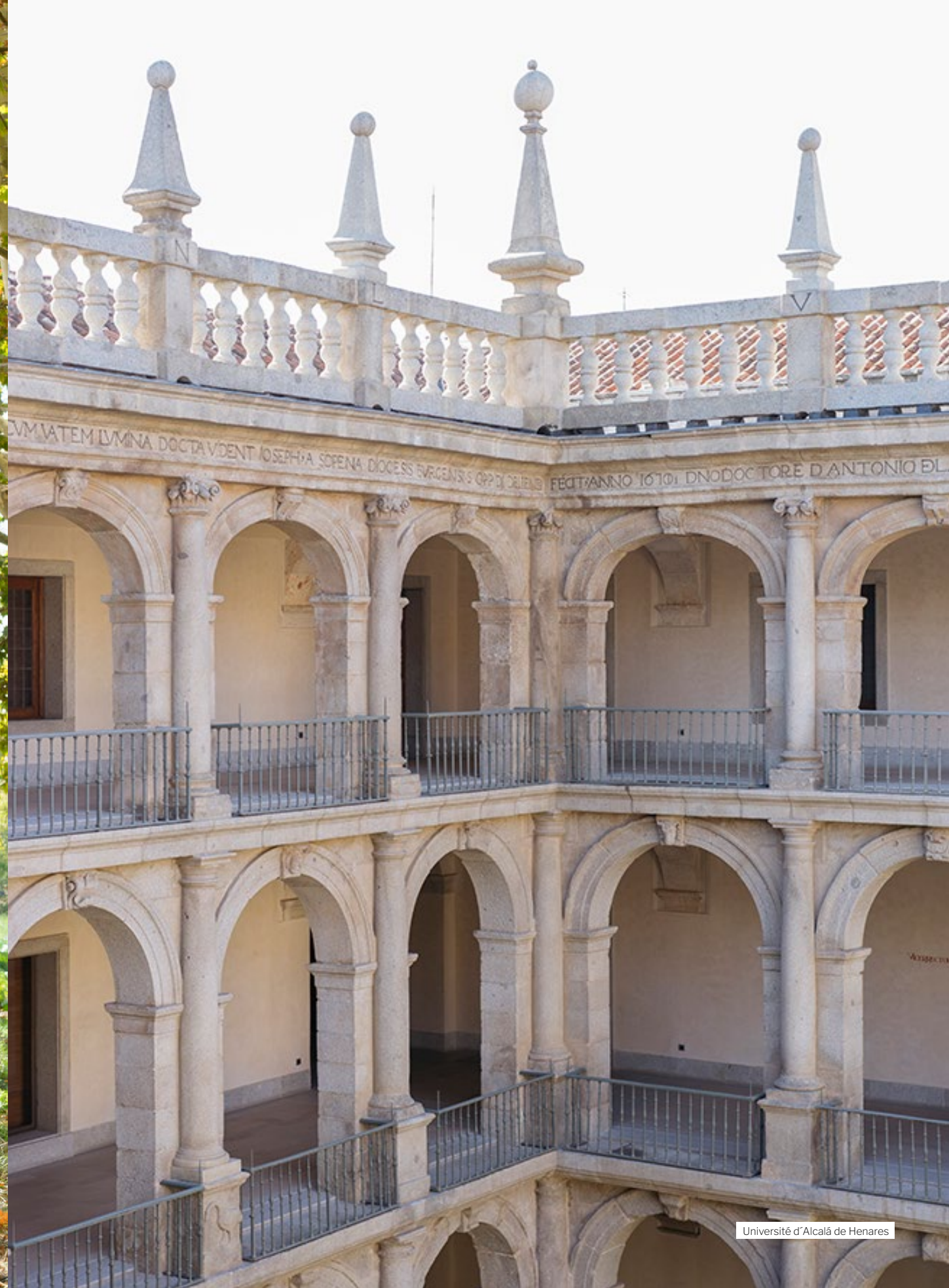
Université d'Alcalá de Henares