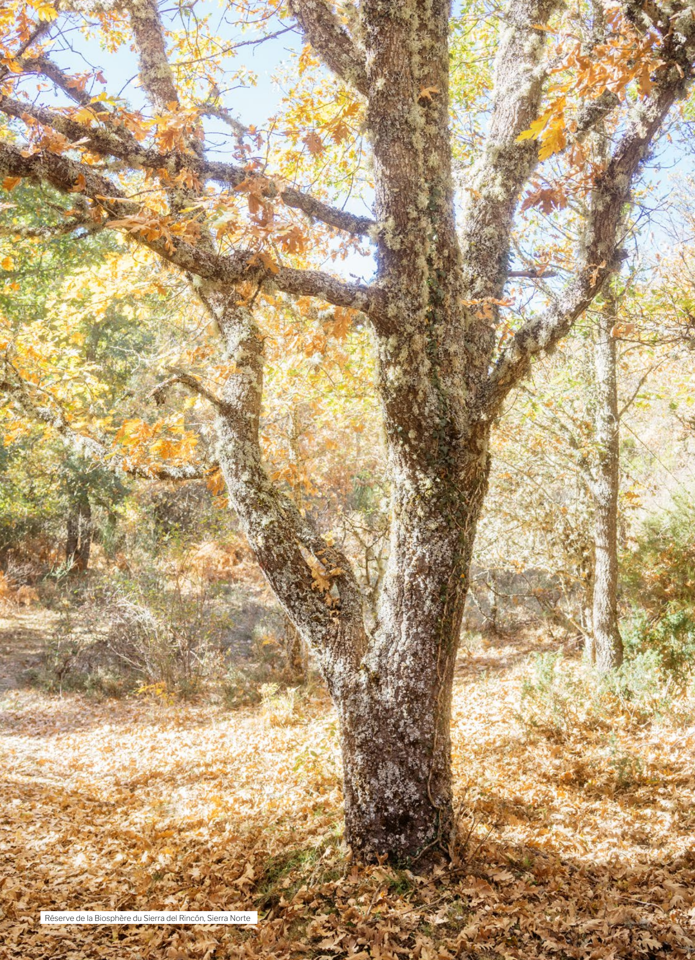
Réserve de la Biosphère du Sierra del Rincón, Sierra Norte