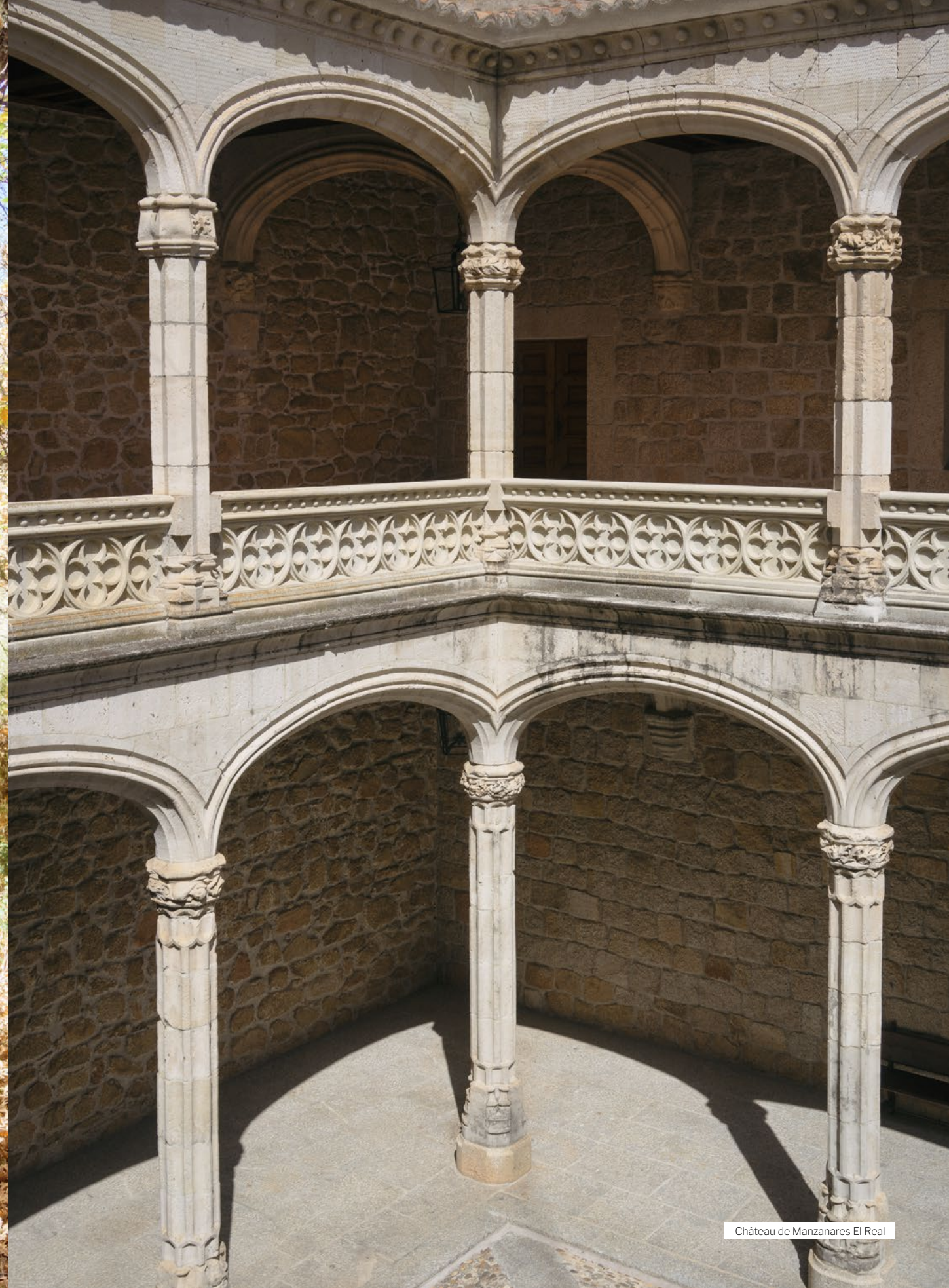
Château de Manzanares El Real