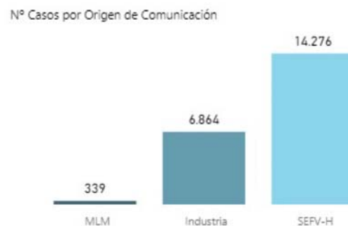
Figura 2. Distribución de las notificaciones espontáneas cargadas en FEDRA en 2017 según origen de notificación: directas al SEFV-H, a través de los titulares de autorización de comercialización (industria) o a través de la empresa MLM, a la que la EMA encarga la revisión de casos publicados en determinadas revistas biomédicas.

Este módulo permite que España se incorpore a los países que pueden realizar evaluaciones sistemáticas de