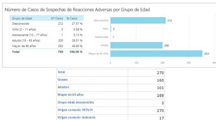
Figura 1.- Notificaciones espontáneas de sospechas de RAM con denosumab hasta 21 de mayo de 2018. En la gráfica el número total por grupo de edad, en la tabla las notificaciones realizadas directamente a los Centros de Farmacovigilancia del SEFV-H

En este ejemplo llaman mucho la atención los 212 casos de FEDRA3 con edad o grupo de edad desconocidos, que significa el 28% de los casos notificados con denosumab. Este posible déficit de la calidad de la información de estas notificaciones puede ser objeto de