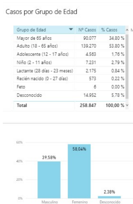
Figura 1.- Notificaciones de sospechas de RAM en FEDRA por Edad y Sexo hasta el 31/03/2019

El número de notificaciones que se realiza con cada medicamento depende de factores como: El tiempo que lleva comercializado, el número de pacientes expuestos o la vigilancia que se realice sobre él. En la Tabla 1 aparecen los principios activos con los que se han notificado más sospechas de RAM, en el conjunto de la base y en los últimos 5 años. Se observa