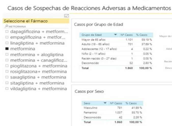
Figura 2.- Informe público de sospechas de reacciones adversas. Selección de fármaco

El número de notificaciones que se realiza con cada medicamento depende de factores como: El tiempo que lleva comercializado, el número de pacientes expuestos o la vigilancia que se realice sobre él. En la Tabla 1 aparecen los principios activos con los que se han notificado más sospechas de RAM, en el conjunto de la base y en los últimos 5 años. Se observa