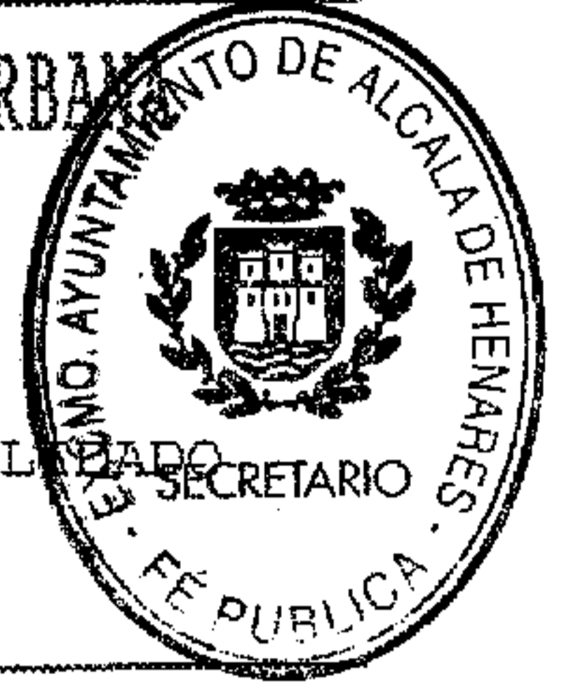
FIGURA DE PLANEAMIENTO: PLAN PARCIAL

CLASE DE SUELO: URBANIZABLE PROGRAMADO Y URBANO CONSOLIDADO