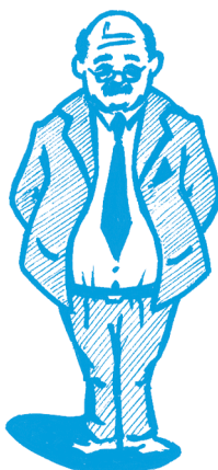
Diabetes Tipo 2