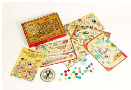
Juegos Reunidos Geyper. Años 50 Fundación Quiroga- Montes