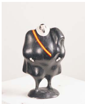
Equipo Crónica Conde-Duque de Olivares, 1971. Escultura en cartón