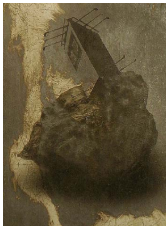
Santiago Serrano. Easy Series, 2006