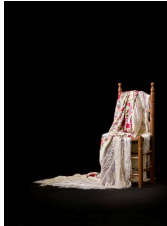
Silla flamenca , 2013 Chema Conesa