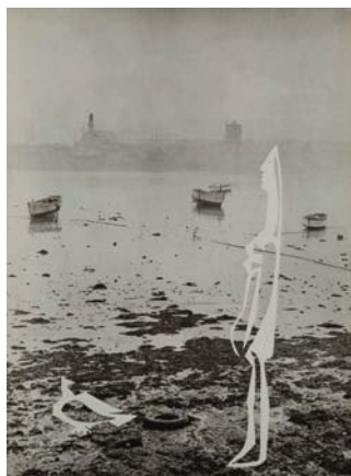
Femme au bord de la mer , 1962. Pablo Picasso/ André Villers. Offset litográfico / Lithographic offset

Comisario: Javier Martín-Jiménez. Hablarenarte