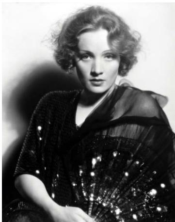
Retrato de estudio de Marlene Dietrich, 1933.