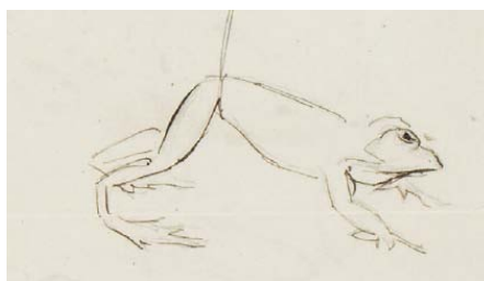
Miguel de Unamuno Con la clara, s/f.