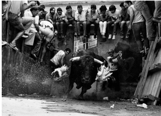
Salida del toro de la tarde. Coria (Cáceres). 1981. Ramón Zabalza