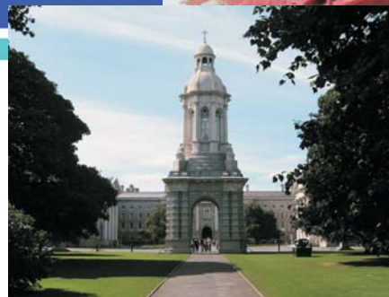
El Trinity College de Dublín