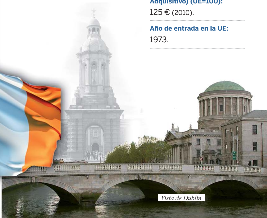
Vista de Dublín