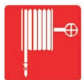
TUYAU POUR POMPES A INCENDIES