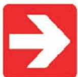
DIRECTION A SUIVRE