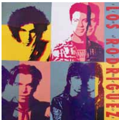
Los Rodríguez. Sin documentos . Ilustración y diseño: Pablo Sycet. Álbum. 1993.