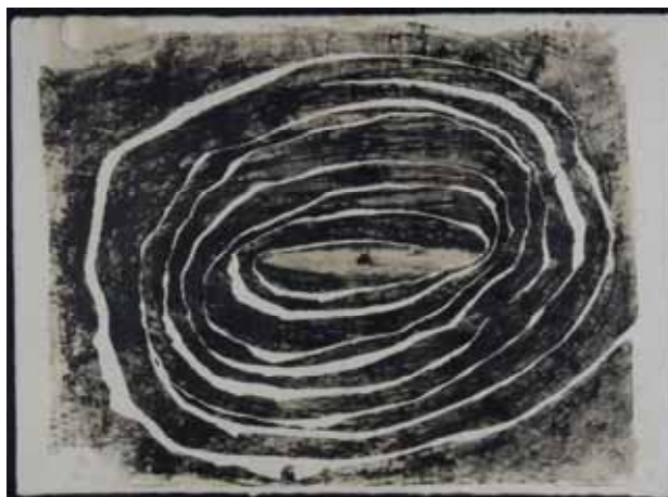
Miquel Barceló. Toro . Litografía, 1990