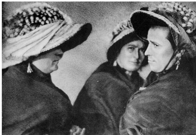
José Ortiz Echagüe. Mujeres con sombreros de paja