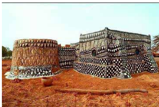
Chozas de Adobe. Burkina Faso, África