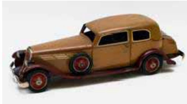
Coche Sedán (1935). Payá. Ibi. Alicante