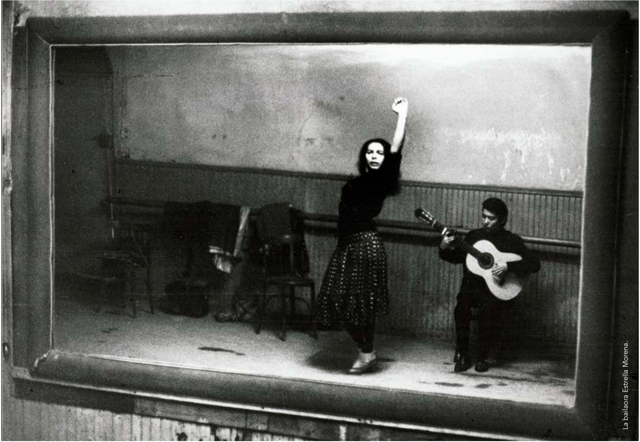
La bailaora Estrella Morena.