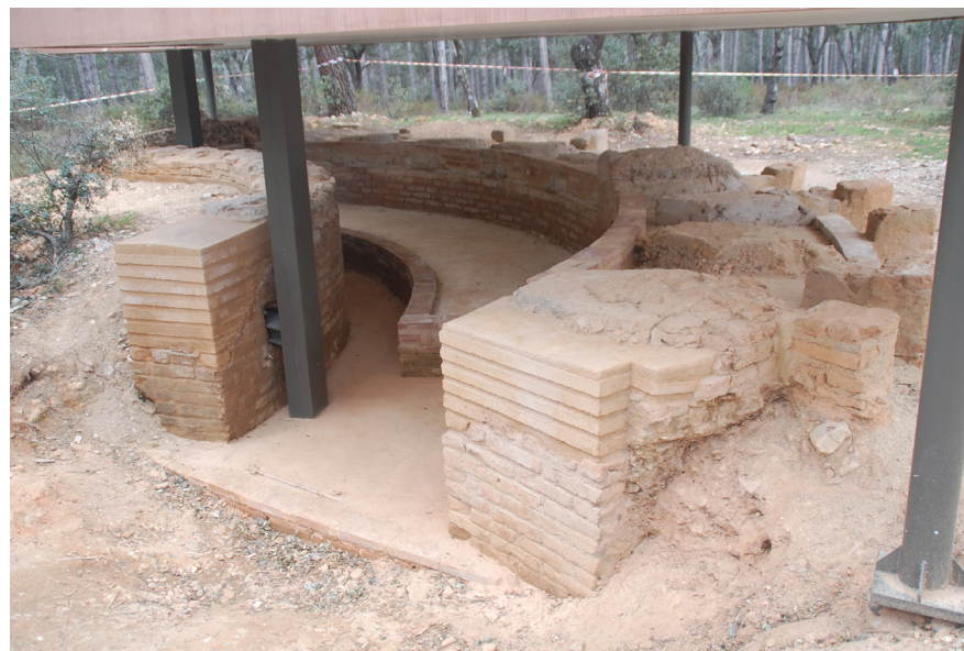
Fig. 11 Acceso a Loma Quemada 4