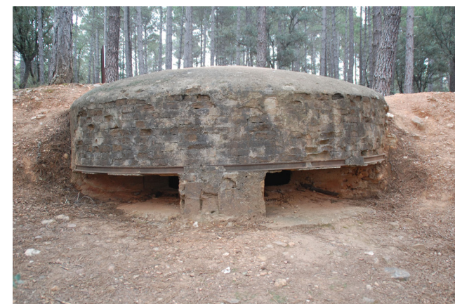
Fig. 9 Exterior de Loma Quemada 5