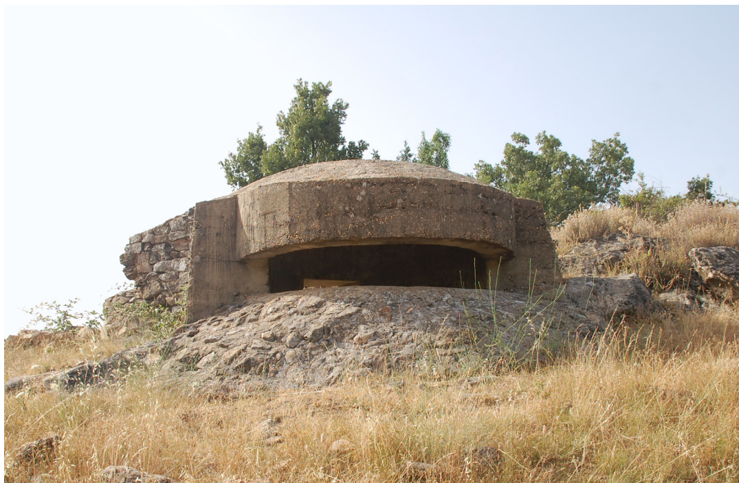
Fig. 2 Exterior Peñas Bajas 1

El diseño de estos nidos de ametralladora es estándar, pero en la práctica difieren mucho unos de otros debido a que siempre han de adaptarse al terreno en el que se construyen, a los materiales disponibles y a la actividad del frente en el momento de la edificación. Todos estos elementos arquitectónicos estaban comunicados por trincheras excavadas en el suelo. Estas líneas de trincheras eran reforzadas en algunas ocasiones con sacos terreros.