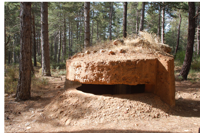
Fig. 4 Frente Pinar 2

Aquí estamos ante otro centro de resistencia del Ejército Franquista. Hay que aclarar que este término de Ejército Franquista ha de usarse siempre para referirse al ejército sublevado a partir del 21 de septiembre de 1936, en que la plana mayor del generalato sublevado le confiere el nombramiento de Generalísimo a Franco – el 28 será nombrado Jefe del Estado. Antes de tal fecha, el término correcto es el de ejército sublevado. Este centro de resistencia, controla directamente la tierra de nadie –el espacio que separa las líneas defensivas de ambos bandos- y que cruza fuego con las posiciones republicanas. La posición agrupaba cuatro nidos de ametralladora, de los que uno actualmente está destruido. Estos nidos tienen forma semicilíndrica y una amplia visión de 180 grados. Al lado de estos nidos, y comunicados con ellos mediante varias líneas de trincheras, se encontraban tres refugios subterráneos destinados a guarecer a la tropa y sus insumos. Las paredes de estas estructuras están construidas con cuarcitas de la zona y los suelos se impermeabilizaron con un simple mortero de cal.