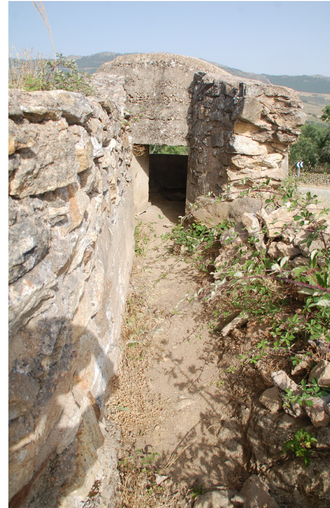
Fig. 3 Acceso a Peñas Bajas 1