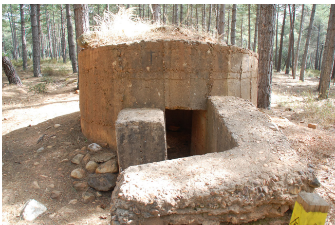
Fig. 5 Acceso a Pinar 2