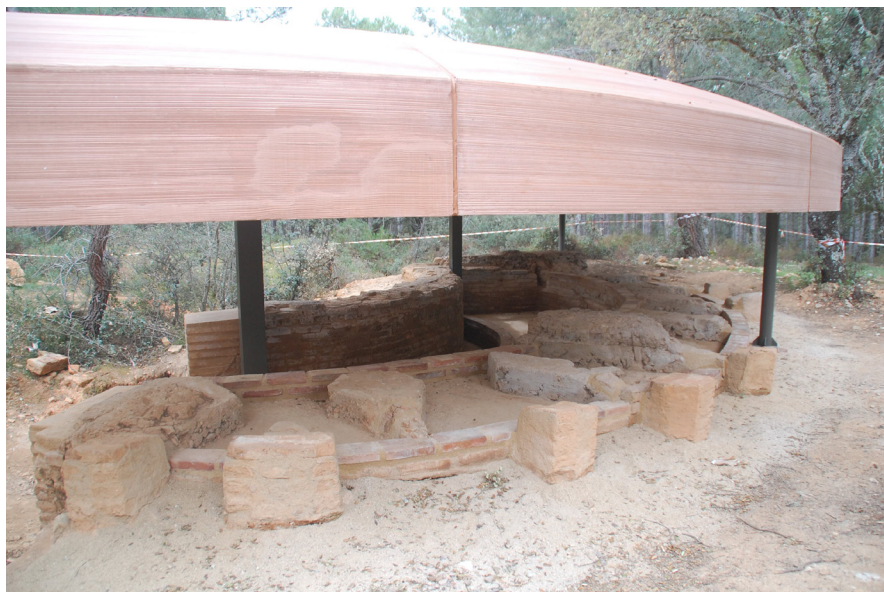
Fig. 10 Frente de Loma Quemada 4

De forma semicircular, se construyó en ladrillo y hormigón. Ha perdido la cubierta -la que vemos actualmente es una recreación-, pero dada la potencia de fuego de este búnker sería, casi con seguridad también de hormigón. En su interior observamos varias bases de apoyo para ametralladoras de posición tipo Maxim , de procedencia soviética, ampliamente utilizadas por el Ejército Popular de la República en la Guerra Civil y por la propia URSS durante la II Guerra Mundial. En la parte interior de la fortificación hay un pasillo que recorre toda la estructura, destinado a municionar las armas automáticas.