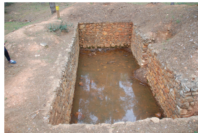
Fig. 6 Interior de un Refugio subterráneo