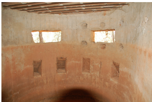
Fig. 8 Interior de Loma Quemada 5