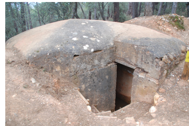
Fig. 7 Acceso a Loma Quemada 5

Aparte de esto, cabe destacar la diferente ejecución de la obra, pues vemos que en este caso, y no es excepcional, se utiliza el ladrillo como soporte del techo de hormigón, que protege a los soldados de impactos artilleros. El uso del ladrillo para los elementos sustentantes es uno de los elementos diferenciales de las fortificaciones del Ejército Popular de la República.