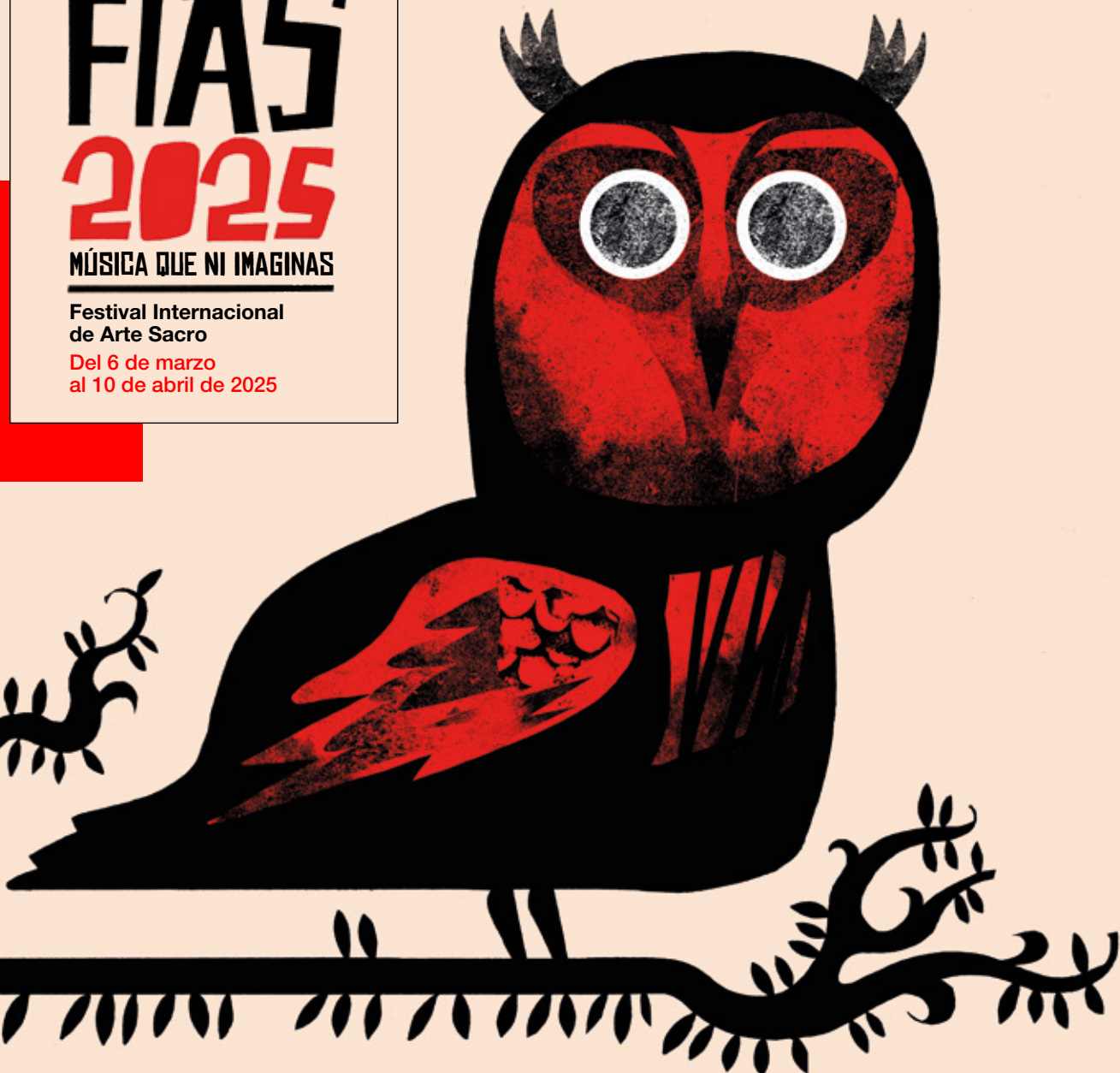
Ilustración: © Javier Olivares.

ALICIA AMO • ANNA COLOM • ARS ATLÁNTICA • AYRES EXTEMPORAE BAB L'BLUZ • BALLARTE ENSEMBLE • BIG BRAVE • CLARA PEYA • COLIN STETSON COLLEGIUM MUSICUM MADRID • CONCERTO DI MARGHERITA CRUDO PIMENTO & PABLO EGEA • DELIRIVM MUSICA • EL GRAN TEATRO DEL MUNDO EMILIA Y PABLO • FAJARDO • JONE MARTÍNEZ • IL FERVORE • LA GRANDE CHAPELLE L'APOTHÉOSE • LA RITIRATA • LE PARODY • LEONOR DE LERA • LOS AFECTOS DIVERSOS LOS SARA FONTÁN & AMORANTE • LUCÍA CAIHUELA • MARÍA ESPADA MARIA MAZZOTTA • MASSIMO SILVERIO • MUSICA ALCHEMICA • NÚRIA RIAL ORQUESTA Y CORO DE LA COMUNIDAD DE MADRID • PEPE VIYUELA & SARA ÁGUEDA RAMPER • SOFÍA COMAS & SONAKAY • THE MINISTERS OF PASTIME • VESPRES D'ARNADÍ EL TEATRO DEL MUNDO / AUTO SACRAMENTAL DE CALDERÓN DE LA BARCA / FOR THE FUN OF IT