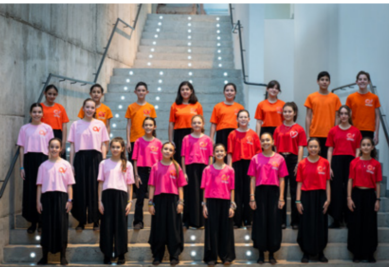
CORO LAS VEREDAS