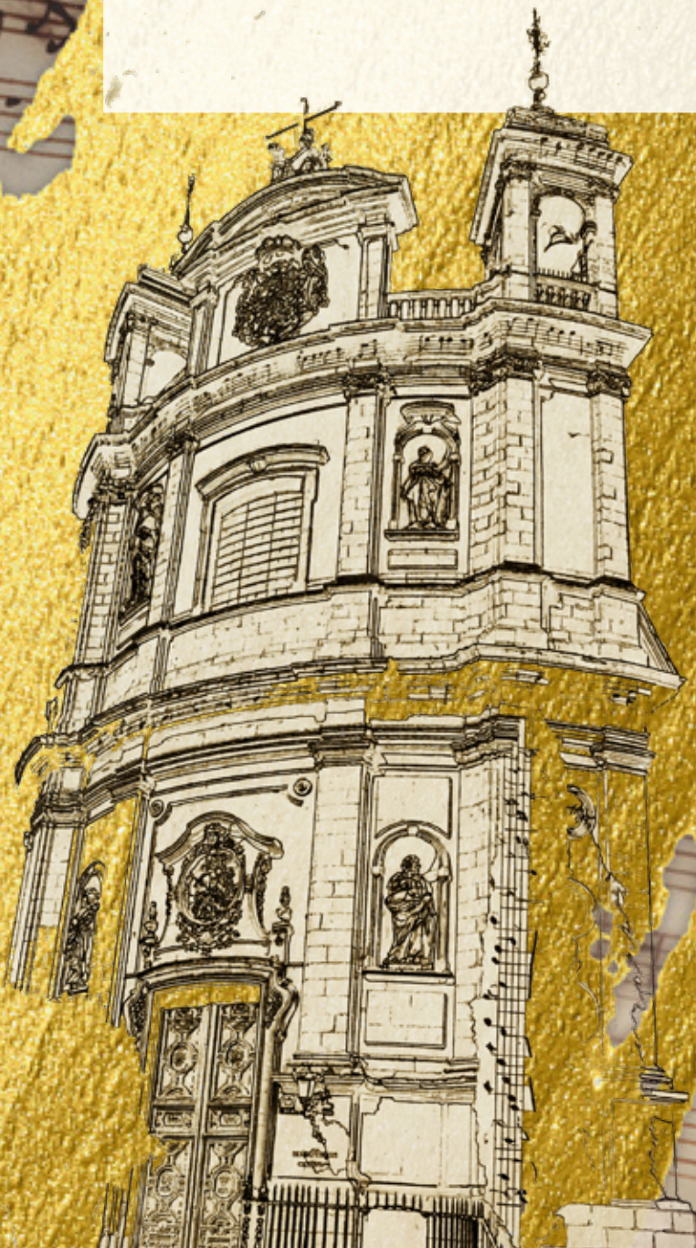
Imagen © David Crespo