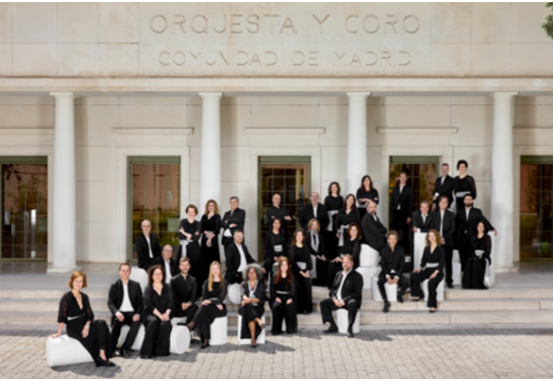
CORO DE LA ORCAM