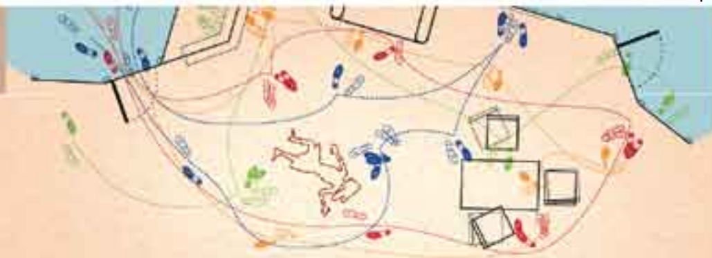
EL DESARROLLO DE LA CIVILIZACIÓN VENIDERA DE DANIEL VERONESE. Versión de Casa de muñecas de HENRIK IBSEN