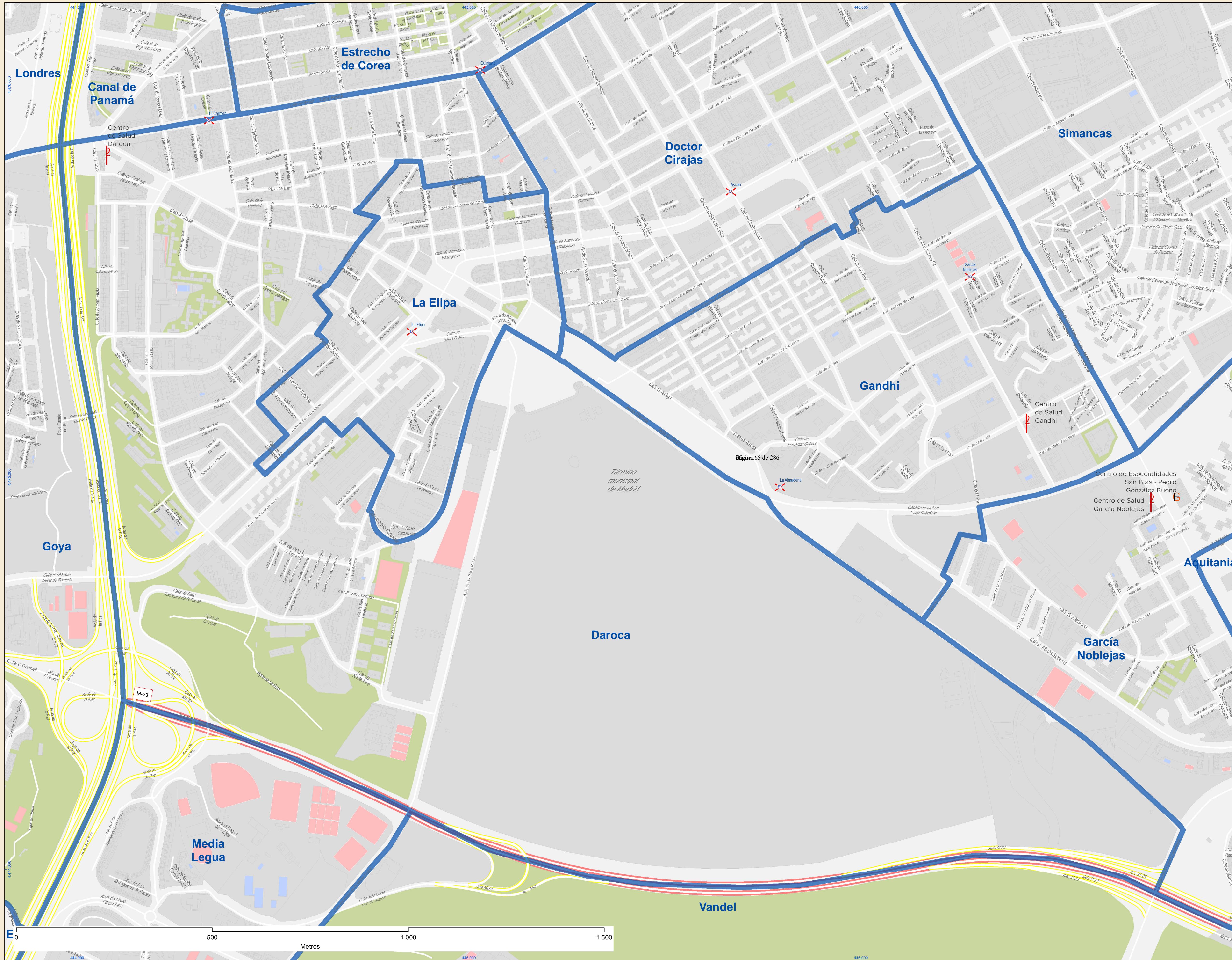
Localización en la Comunidad de Madrid