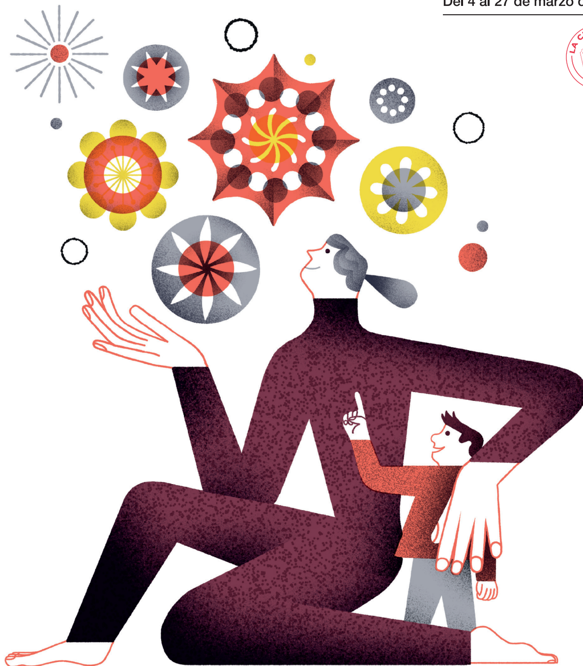
Ilustración: Malota 2022